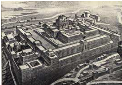
Judovski tempelj v Jeruzalemu

(porušili so ga Rimljani leta 70 po Kristusu)