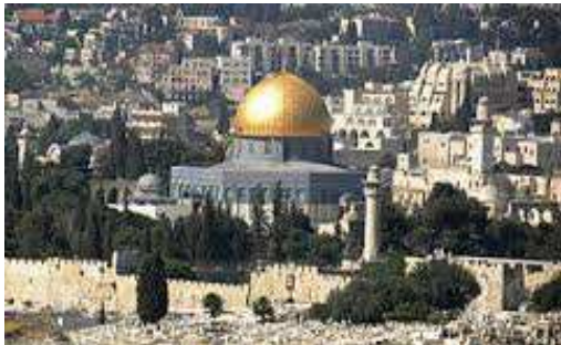
Prostor, kjer je nekoč stal jeruzalemski tempelj

(porušili so ga Rimljani leta 70 po Kristusu)